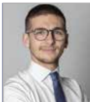
Pedron Gianluca Edilizia Privata, Urbanistica