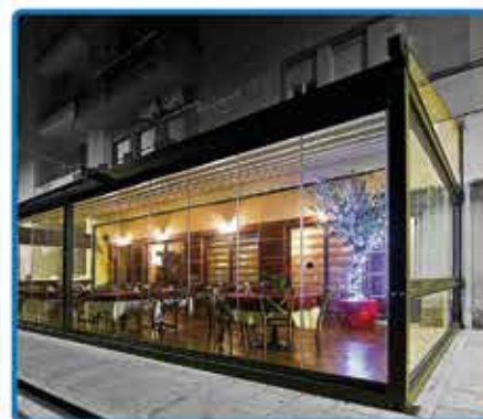
Tenda Pergola con serramenti di chiusura su preventivo

PREZZO SPECIALE PER CAMBIO TELO IMPERMEABILE