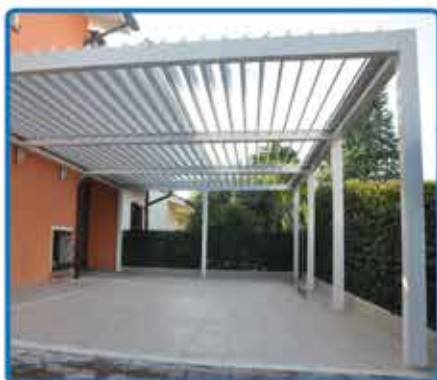
Pergola Bioklimatica con motore larg. 400 - Sp. 350 € 5.000,00