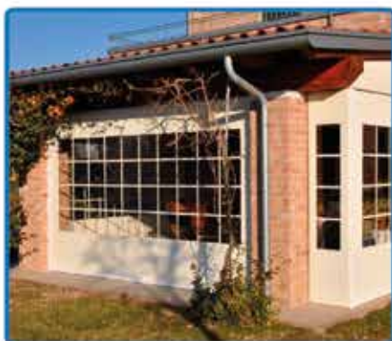
Rullo ZIP con finestra Larg. 300 - H. 250 € 600,00