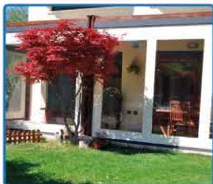
Rullo ZIP con finestra Larg. 300 - H. 250 € 600,00

LE TENDE DI MARCA SCONTATE DEL 35% MONTAGGIO COMPRESO È ARRIVATO L'INVERNO, RIPARATI dal VENTO e dalla PIOGGIA con le TENDE A RULLO ZIP, le PENSILINE e le TENDE-PERGOLA