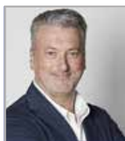
Peron Samuele Sport e Sicurezza