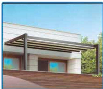
Tenda Pergola con motore Larg. 450 - Sp. 400 € 2.800,00