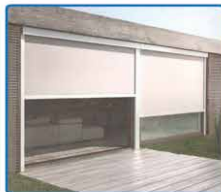
Tenda Oscurante con cassonetto e guide Zip - Larg. 300 - H. 250 € 650,00