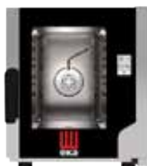
EKF 523 NT UD