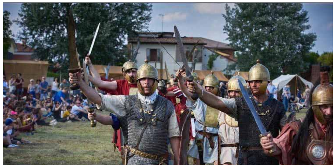
L'esercito romano sfila vittorioso dopo la battaglia