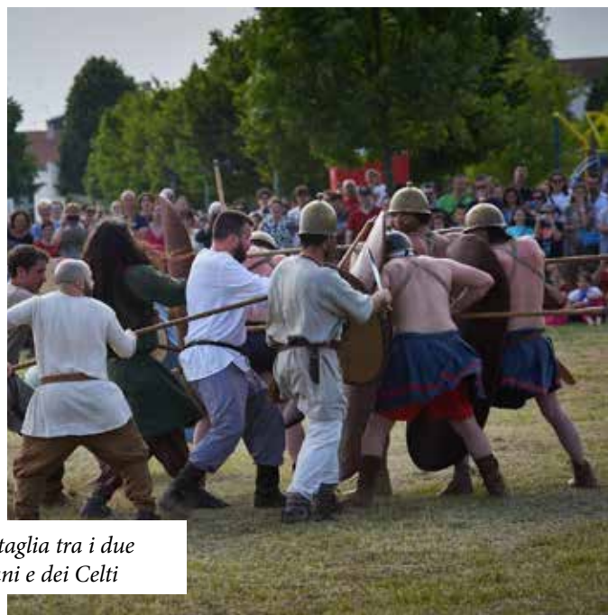
Momenti della battaglia tra i due eserciti dei Romani e dei Celti