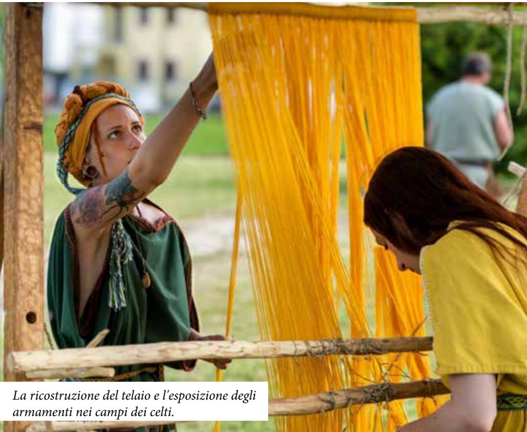
La ricostruzione del telaio e l'esposizione degli armamenti nei campi dei celti.

Un tuffo magico nel passato a Borgoriccio