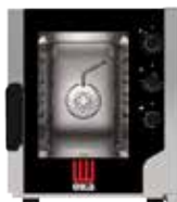
EKF 523 N UD