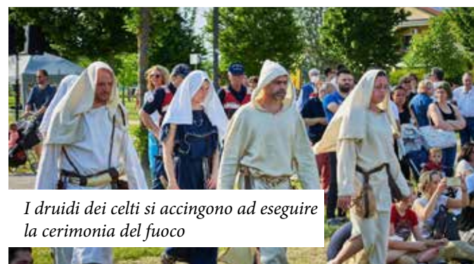
I druidi dei celti si accingono ad eseguire la cerimonia del fuoco

LA FORZA DEL NOSTRO GRUPPO: UN'UNICA SQUADRA AL SERVIZIO DI OGNI TUA ESIGENZA