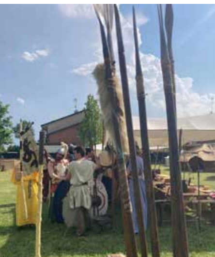
La ricostruzione del telaio e l'esposizione degli armamenti nei campi dei celti.

Centuriazione Romana è stato aperto con ingresso gratuito dalle 9 alle 19,30 ed è stato possibile seguire gratuitamente visite guidate e diversi laboratori didattici a cura di Scatola Cultura s.c.s. Due giorni di atmosfera fantastica con centinaia di visitatori, culminati con la grande battaglia tra i due eserciti: uno spettacolo per grandi e piccoli che cerchiamo di rievocare con queste foto.