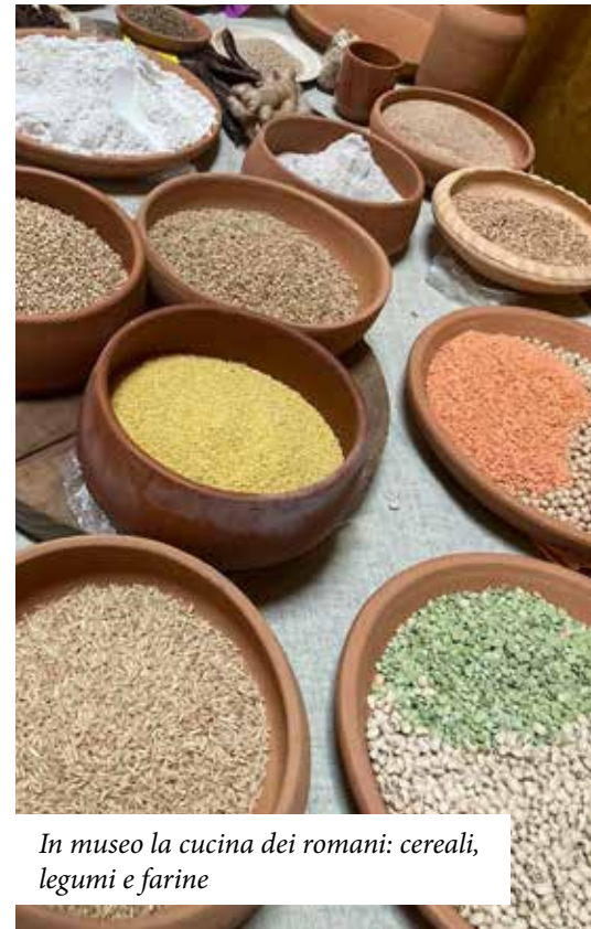
In museo la cucina dei romani: cereali, legumi e farine

Dopo dodici anni è ritornata a Borgoriccio la Rievocazione storica del Graticolato Romano, con due giorni di immersione totale nell'antichità e nella storia. Il 14 e il 15 maggio Borgoriccio si è svegliata nella Roma di età imperiale, con tanto di Termopolio, dove assaggiare prelibatezze romane e accampamenti di Celti, Romani e dei gladiatori, ricostruiti fedelmente dai gruppi di rievocatori